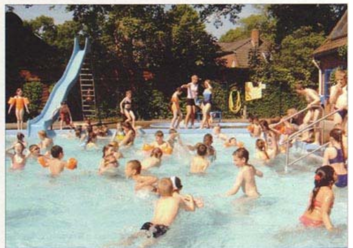
Badespaß heute: Dank des ehrenamtlichen Engagements vieler Helfer haben es Neuwiedenthals Kinder nicht weit ins Schwimmbad. Im Sommer gibt es ein großes Jubiläumswochenende

„Dass wir unser Freibad Neugraben damals erhalten konnten, lag wirklich daran, dass es uns gelungen war, einen